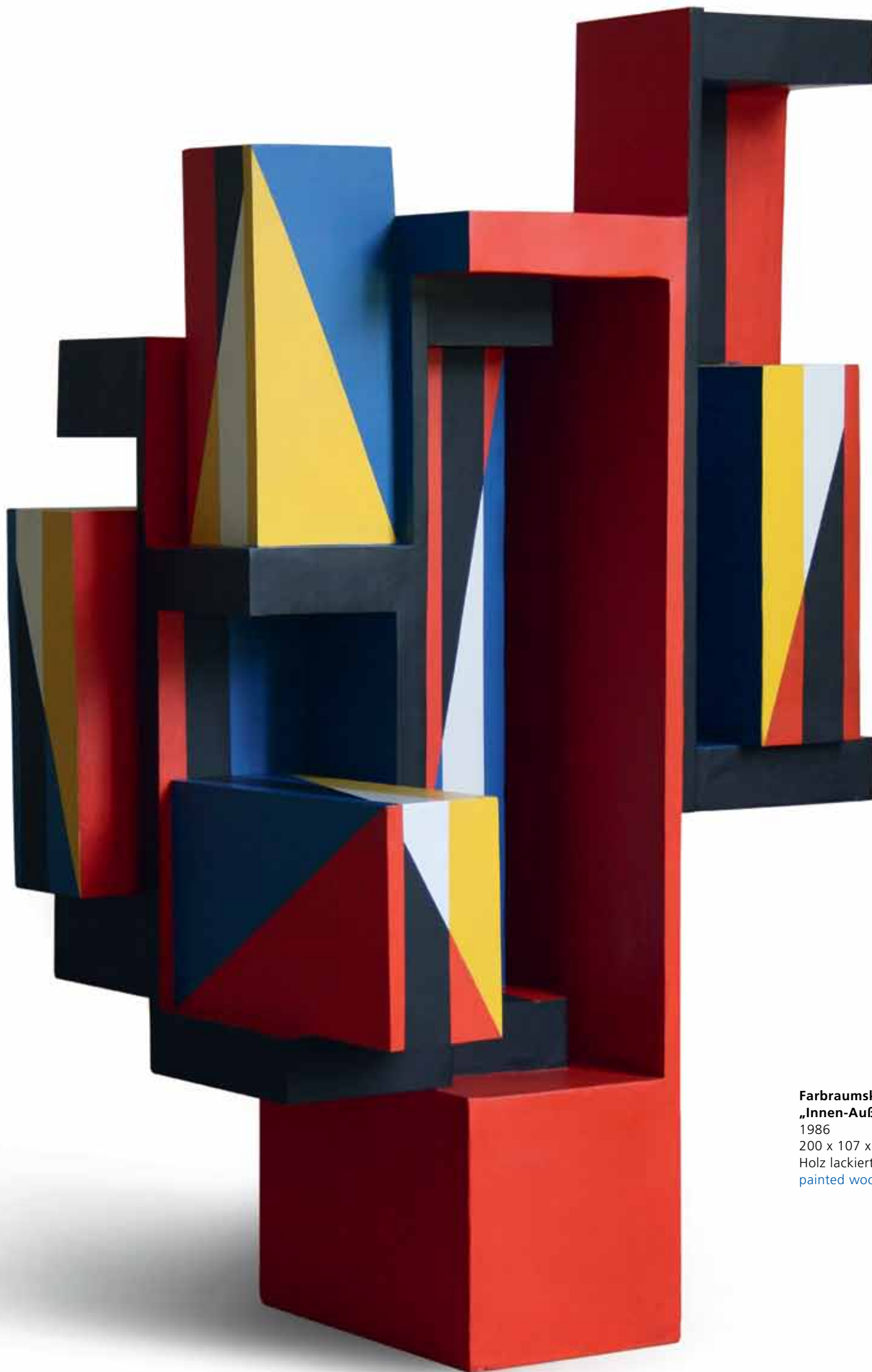
Farbraumskulptur „Innen-Außen“ 1986 200 x 107 x 89 cm Holz lackiert painted wood